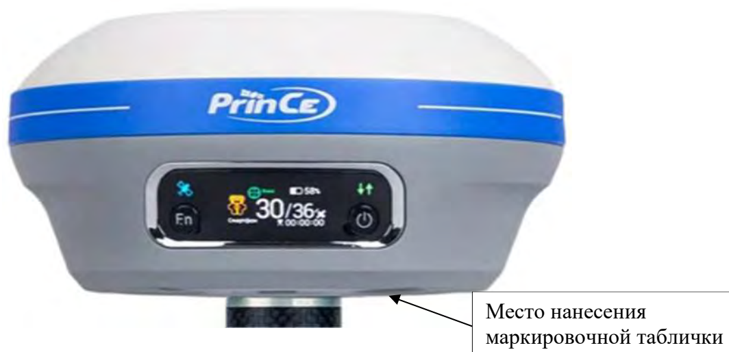
Рисунок 1 – Общий вид аппаратуры геодезической спутниковой PrinCe i80

Общий вид маркировочной таблички представлен на рисунке 2.