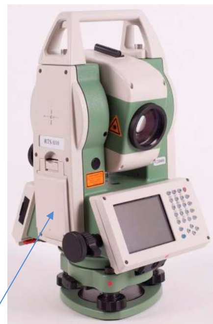
в) Модификация RTS010