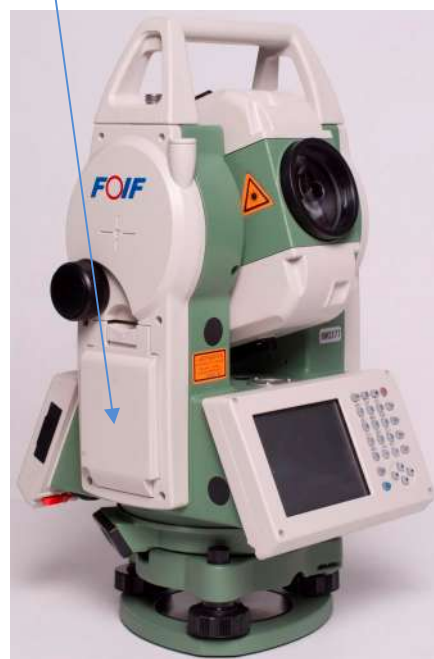
д) Модификация RTS362