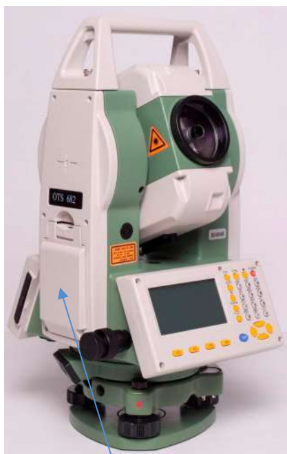
б) Модификация OTS682