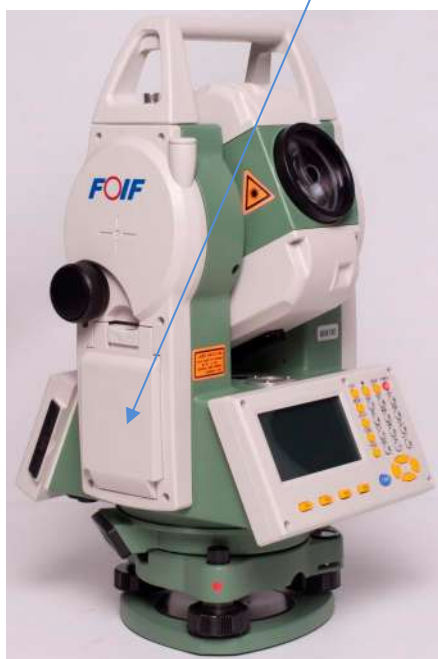
г) Модификация RTS332