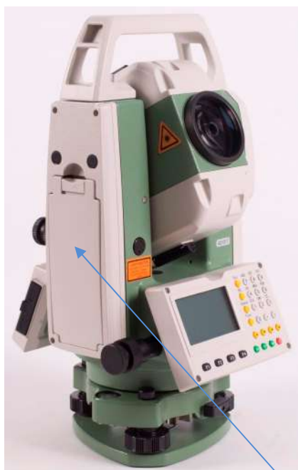
а) Модификация RTS102