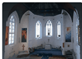
Культурный туризм и сохранение исторического наследия