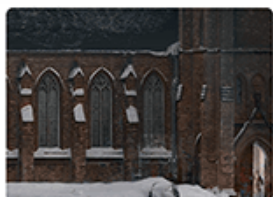
Архитектурные обмеры и обследования