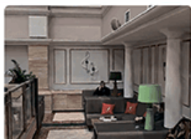
Дизайн интерьеров и реконструкция