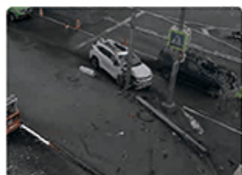
Документирование сложных ДТП и криминалистический анализ