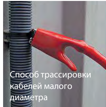
Способ трассировки кабелей малого диаметра