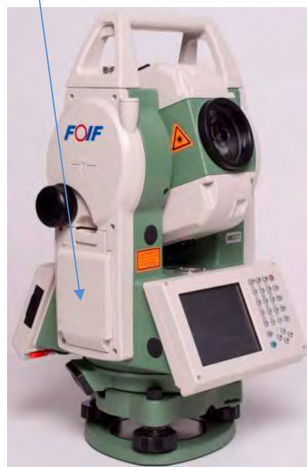
д) Модификация RTS362