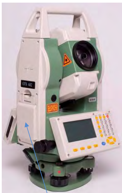
б) Модификация OTS682