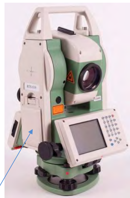
в) Модификация RTS010