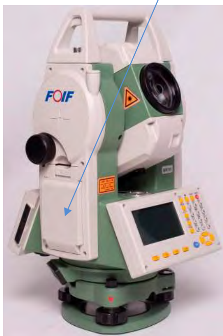
г) Модификация RTS332