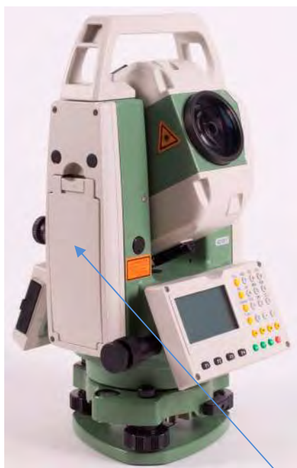
а) Модификация RTS102